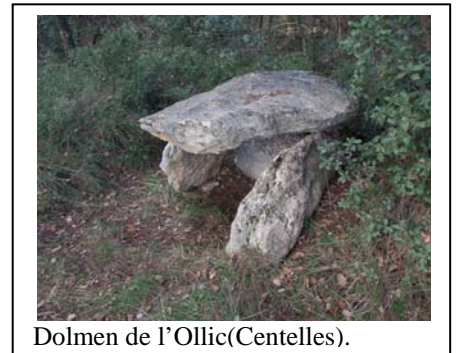
Dolmen de l'Ollic(Centelles).

Exemples que veurem: dolmen del serrat de Puigventós, dolmen de Cruïlles.