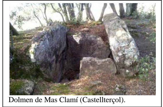
Dolmen de Mas Clamí (Castellterçol).

Exemple que veurem: Cista de Creu de Parròquia.